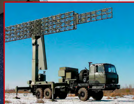
ОАО «КБ «РАДАР»

ВОЕННО-ПРОМЫШЛЕННЫЙ КОМПЛЕКС. БЕЛАРУСЬ | MILITARY-INDUSTRIAL COMPLEX. BELARUS | ВОЕННО-ПРОМЫШЛЕННЫЙ КОМПЛЕКС. БЕЛАРУСЬ | MILITARY-INDUSTRIAL COMPLEX. BELARUS | ВОЕННО-ПРОМЫШЛЕННЫЙ КОМПЛЕКС. БЕЛАРУСЬ | MILITARY-INDUSTRIAL COMPLEX. BELARUS