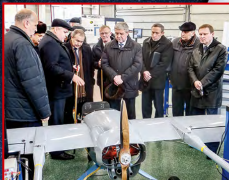
ОАО «558 АРЗ»